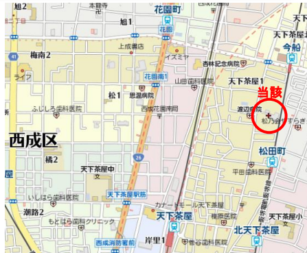
※物件対象地 参考地図