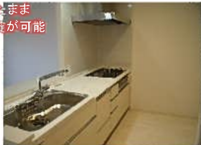
アクリル人工大理石(ハイグレード)