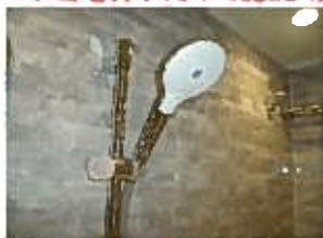
節水・適度な刺激感を 両立したシャワーです